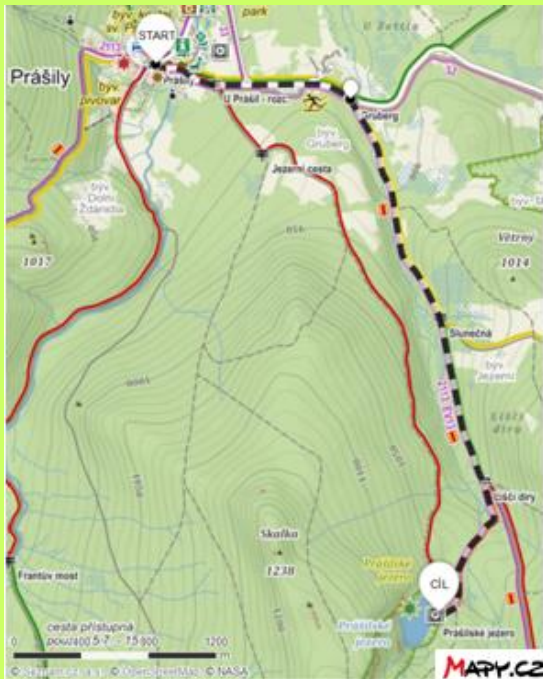
a) Trasa s kočárkem