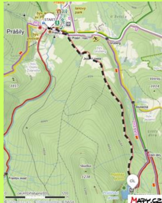
b) Trasa s nosítkem či krosnou na dítě